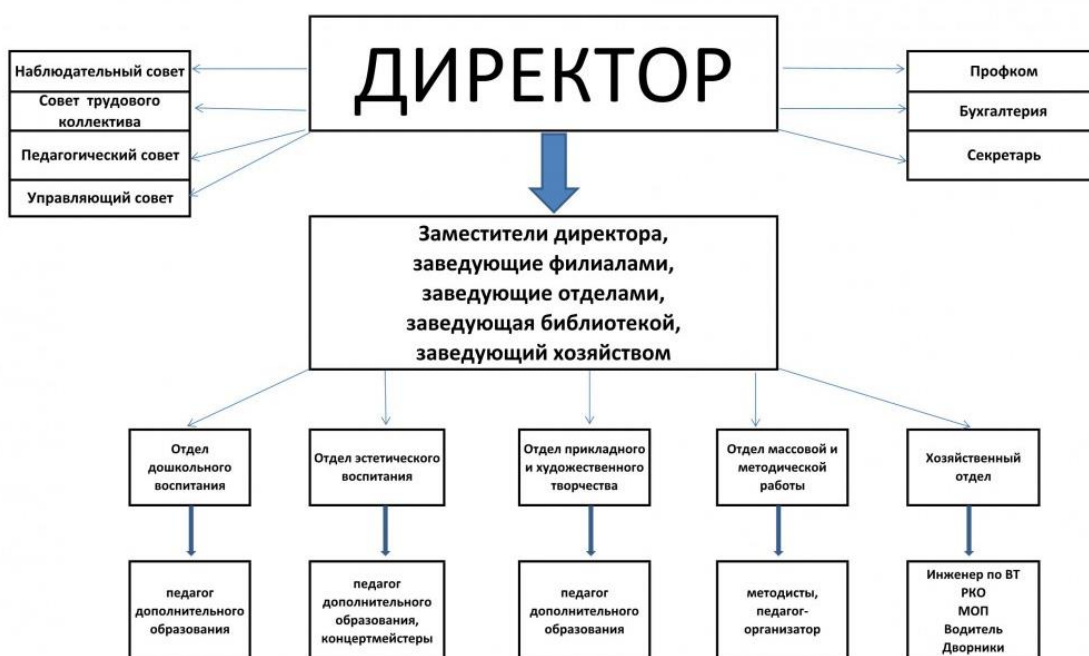
СТРУКТУРНО-ФУНКЦИОНАЛЬНАЯ МОДЕЛЬ УПРАВЛЕНИЯ ПЕДАГОГИЧЕСКИМ ПРОЦЕССОМ МАОУ ДО ДТ "ОКТАБРЬСКИЙ"

В 2023 году в учреждении действует коллективный договор на 2022-2025, принятый 27.06.2022.